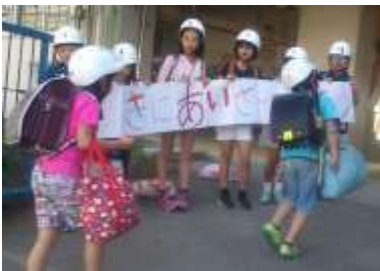
【あいさつ運動風景】

目と目を合わせ、自分から先にあいさつをしてくれるので、大宮北小の子ども達の素直さに、とても感心させられました。