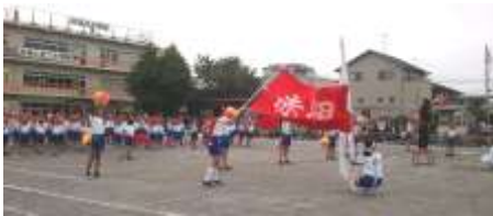
< 熱く燃えた応援合戦 >

「秋の日は釣瓶（つるべ）落とし」の例えのように、日没の早さを感じる季節となりました。9月21日（土）の運動会には、多数のご来賓の皆様、保護者、地域の皆様にご来校いただき、誠にありがとうございました。また、近隣の皆様には、練習の音等でご迷惑をおかけした