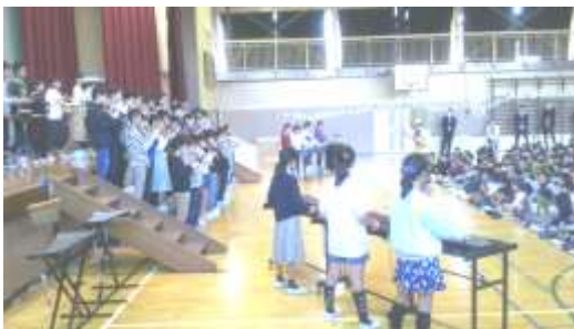
＜ミュージックフェスティバル「6年：アフリカン・シンフォニー」＞

時の経つのは早いもので、もう師走の声を聞くところとなりました。校庭の木々も秋の深まりとともに美しく色づき、今では落葉へと移ろいました。保護者、地域の皆様におかれましては、ご健勝にてお過ごしのこととお察し申し上げます。